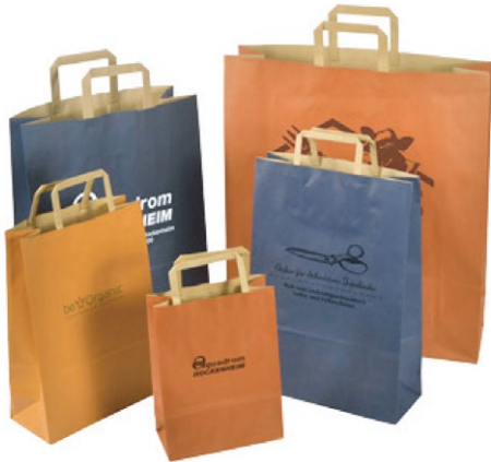
rot Nr.21 orange Nr.23 blau Nr.30