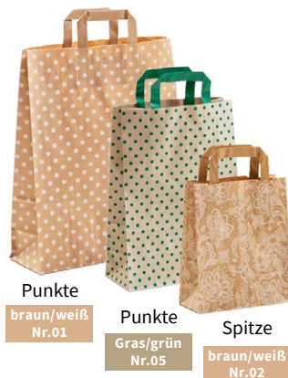
Punkte braun/weiß Nr.01 Punkte Gras/grün Nr.05 Spitze braun/weiß Nr.02