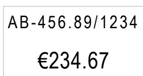
Etikett: 37x19mm Auszeichner: Blitz X47