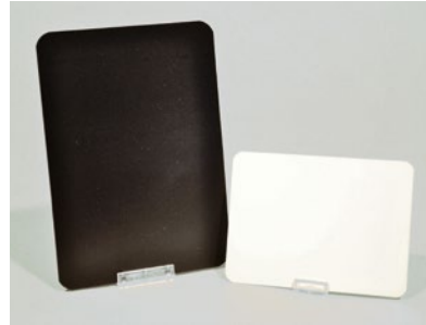
Kunststofftafeln mit Liegendhalter