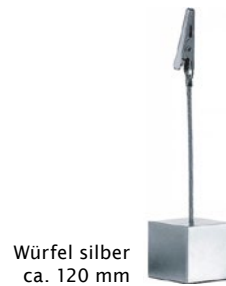
Würfel silber ca. 120 mm

Liegendhalter für Kunststofftafeln oder Karton, Material: Acryl transparent, VE=10 Stück, Preis pro VE