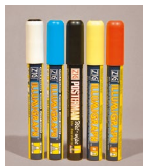
Kreidestifte 2-5 mm