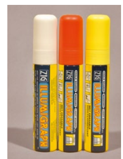
Kreidestifte 5-15 mm